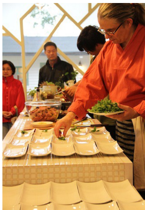
Gustation au Jus Zhi Xiang à Yilan (Taïwan) 1 représentation, 35 convives, à l'heure du déjeuner