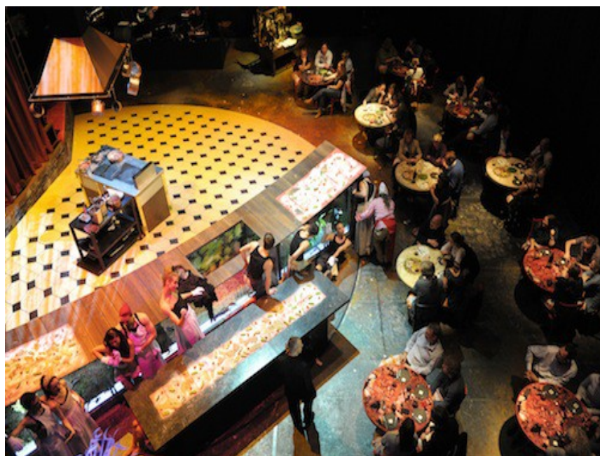
Gustation intégrée à la chorégraphie de Mei Hong Lin : Tödlicher Genuss 8 représentations au Tanztheater de Darmstadt (Allemagne) 40 convives, à l'heure du dîner