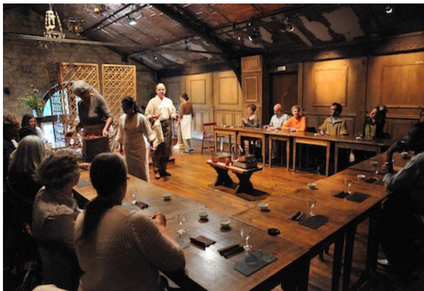
Gustation au Théâtre de l'Epée de bois Cartoucherie, Paris. 16 représentations, 21 convives, à l'heure du goûter

Performance multiforme, apparition unique selon le lieu et le contexte.